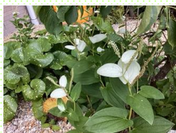
はんげしょう 半夏生