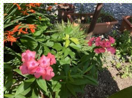
おいらんそう 花魁草