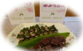
ミニ桜餅と水ようかん