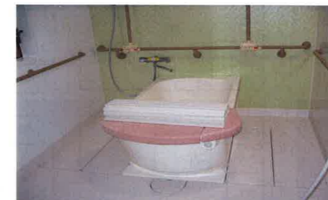
【ユニットの浴室】 ～ゆっくりと入っていただける個浴です～