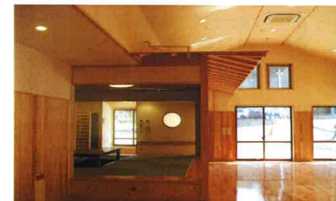
【地域交流スペース】 ～地域の人たちが、気軽に集まれる場所です～