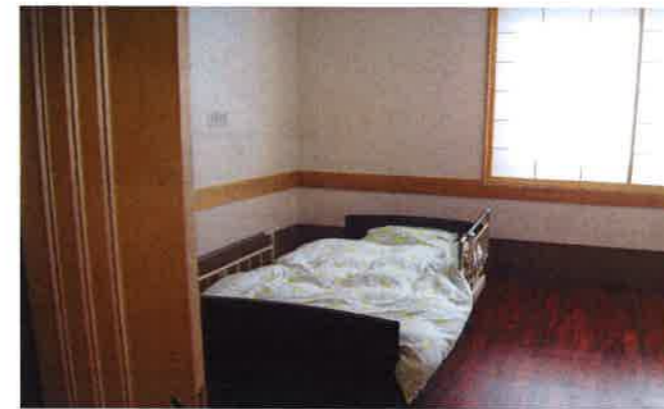
【居室】 ～木調を取り入れ、落ち着いた雰囲気個室です～