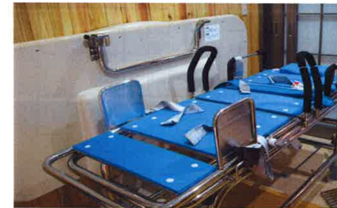
【天井走行式リフト】 ～電動昇降着替え台を備えた、安全な機械浴です～