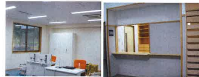
【ケアプランセンター】 【地域包括支援センター】 【診療所】

自分らしい生き方をさせていただくために・・・ あらゆる場面において、利用される方の尊厳を守ることが大切と わたしたち「石野の里」は考えています。