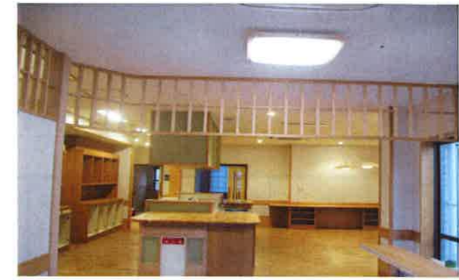
【共同生活室】 ～温かい家庭的な居間の雰囲気です～