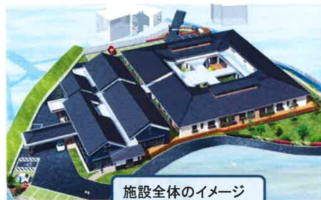
施設全体のイメージ

構造／ 鉄骨造平屋建 敷地面積／5,220.11㎡ 建築面積／2,229.01㎡ 特別養護老人ホーム 定員 29名 ショートステイセンター 定員 10名 デイサービスセンター 定員 15名 他事業所／ケアプランセンター 地域包括支援センター 地域交流スペース 診療所