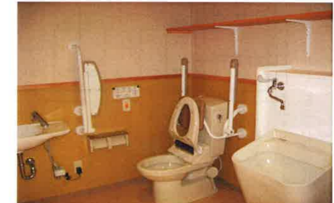
【ユニット内のトイレ】 ～居室にトイレがない分、スペースを広くとることができました。汚物流しも備えています～