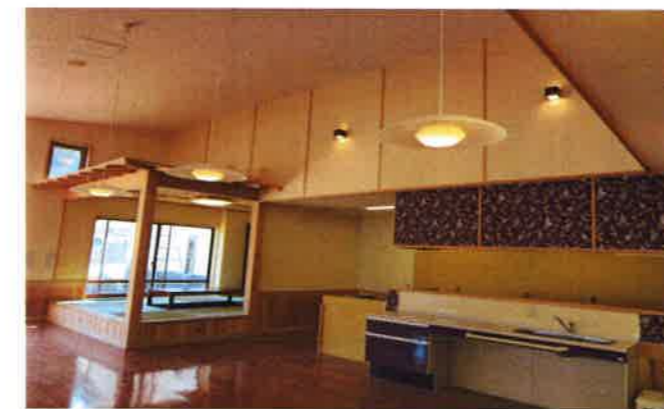
【デイサービス】 ～一段低くした対面カウンターで、利用者さんと一緒に料理やおやつ作りを楽しみます～