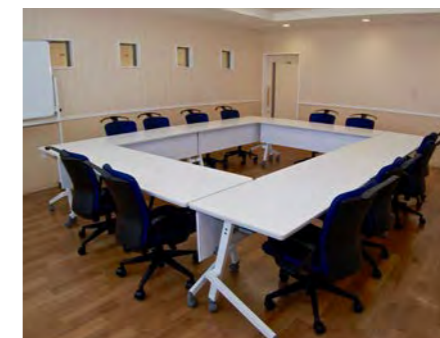
多目的ホール 地域の方々との交流や様々な催事を開催。