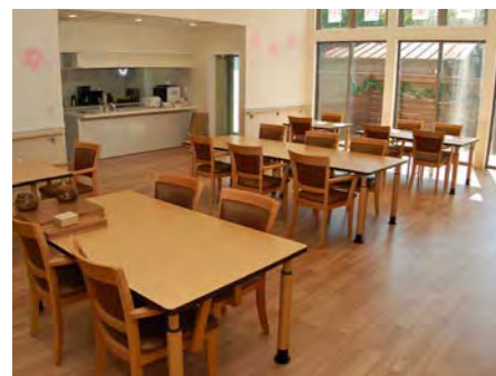
テラスに面した明るい食堂・居間。 時には調理のお手伝いに参加していただくことも。

充実した看護、介護体制と設備、そして人を想う心。笑顔が絶えない空間で、「自分らしく」お過ごしいただけます。