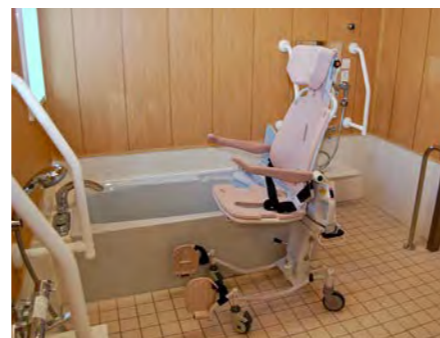
浴室一例 入浴リフト付シャワーキャリー完備。