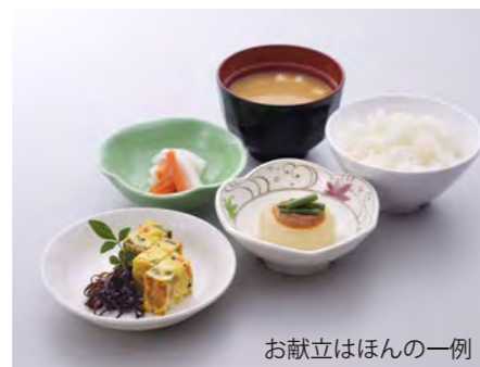
季節感のある家庭的なお食事。 それぞれの状況に合わせた調理方法でご提供。