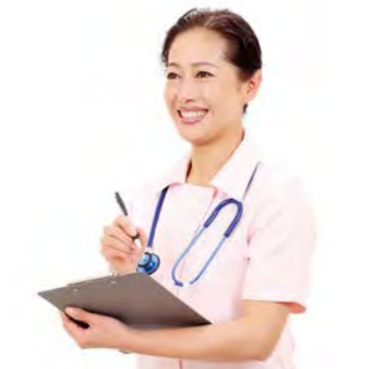
安心の看護師在駐体制。 近隣の協力病院と緊密な連携を図っています。