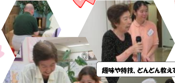
趣味や特技、どんどん教えて下さい