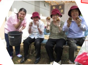
さつまいも、 獲れました