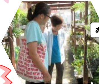
お天気の良い日は外出！