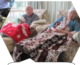
お身体、休めましょ。