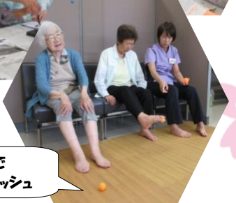
ピンポン玉体操で つま先からリフレッシュ