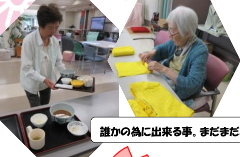
誰かの為に出来る事。まだまだあります