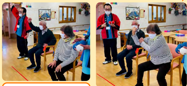
ジャッジ中・・・。