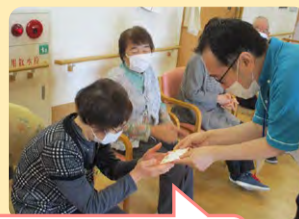
3月16日 サロン当日が誕生日!