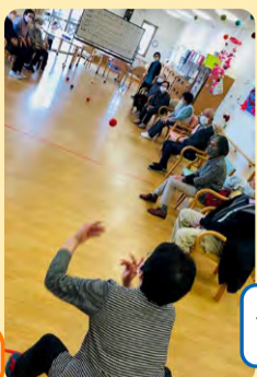
青組の勝利! やったー