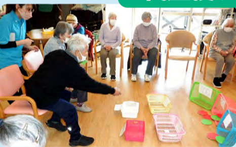
5月に向けて 利用者さん達で藤の花作成 をしています。