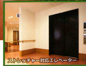
ストレッチャー対応エレベーター