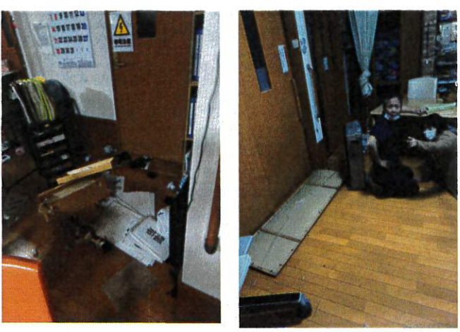
震災直後の2階の様子です。

編集後記 1月1日の元旦に起こった能登半島大地震。まずは、被害にあった関係各位の皆さまに、謹んでお悔やみ申し上げます。 1日のあの日、小規模の利用者さんと額神社に初詣へ行き、帰ってきてからの一瞬中に起こった地震。恐怖に怯える利用者、スタッフ。額や神棚、ありとあらゆる物が落ちてきて皆で体を寄せ合い、暫く1階に2階利用者を泊めました。 一生忘れることのない出来事だったと思います。スタッフ、スタッフの家族、利用者、利用者の親族等...。被害報告も聞いております。 経営者の傍ら、議員として、今何ができるか？ 今後どうするか？ そして、自然災害にいかに関心があるか、深く考えさせられました。 とにかく、1日も早い能登の復興を願います。そして、こんな地震が二度と起きないことも節に願います。 (丸井)