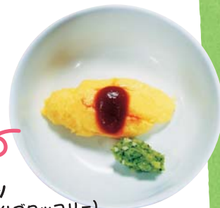
オムレツ (付けあわせブロッコリー)