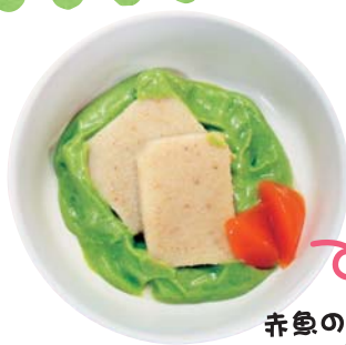
赤魚のムニエル (つけあわせ人参)

味や香り、見た目に配慮して利用者様の食べる意欲を引き出すような食事作りを目指して日々の業務に奮闘しています。「嚥下障害だから仕方がない」ではなく、「障害があるからこそおいしく食べてもらいたい」この視点に立ち、利用者様の「食べたい」という声に応えるよう給食委員会、給食スタッフ一同心をひとつにして美味しい食事を提供していきます。