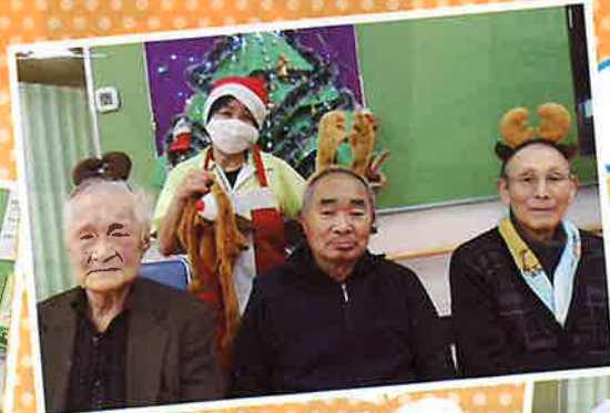
男前なトナカイと 美人なサンタクロース