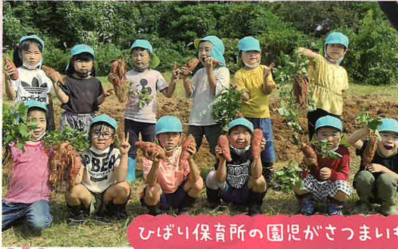
ひばり保育所の園児がさつまいも掘りをしました。