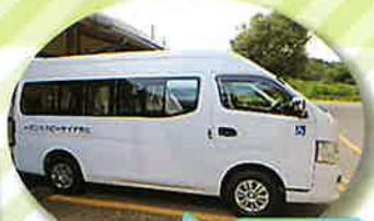
新車が入りました。安心安全に送迎を致します。