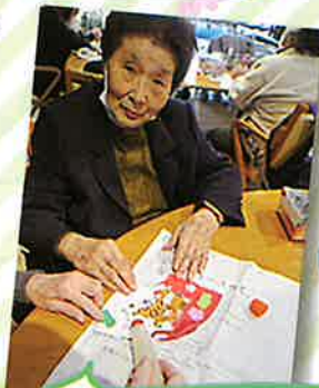
干支の飾りを作りました。