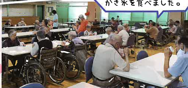
暑いので かき氷を食べました。