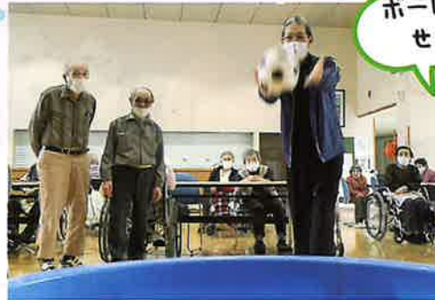
ボール入れ大会 せーのっ!