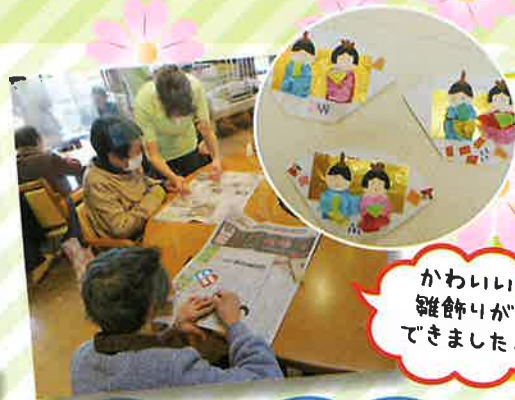
かわいい雑飾りができました。

コロナ禍にあり閉じこもりがちですが、七見デイサービスで安心して、楽しく笑い合い、支えあい和みあって、日常生活能力や心身機能の維持・向上を図りましょう。是非、ご利用ください。