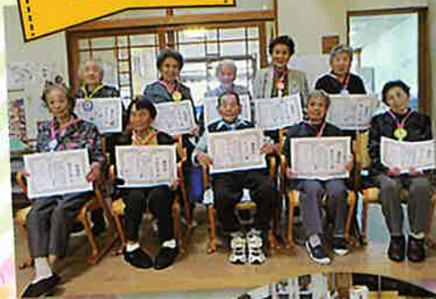
敬老の日に日頃の感謝を込めてメダルと感謝状を贈りました。