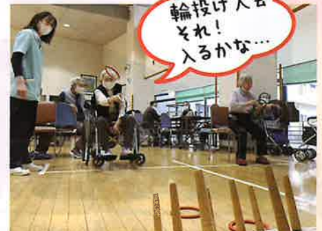
輪投げ大会 それ! 入るかな...