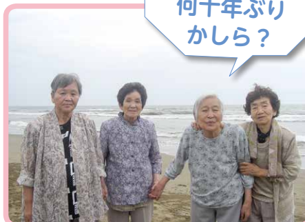
△千里浜にドライブ(7月)