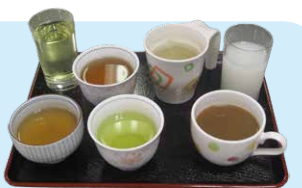
△緑茶、麦茶、コーヒー、スポーツドリンクなど

年間を通して1日1,000cc以上の水分をとっていただいています。また、水分補給と運動も行うことによって排泄リズムが確立され、健康な身体を作ります。