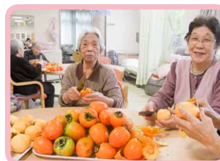
△干し柿作り おいしくなあれ(11月)