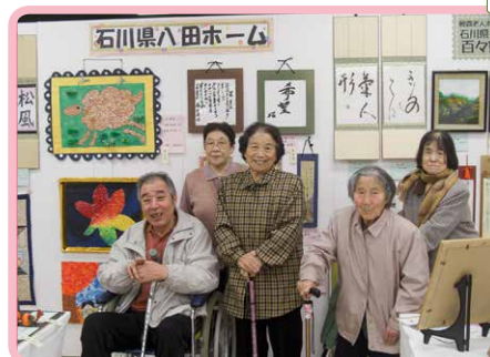
△余技展 素敵なお作品ばかりでした(11月)