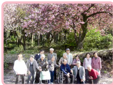
△俱利伽羅へ八重桜を見に(5月)