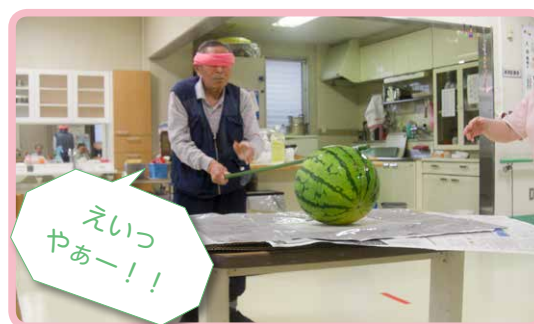
△スイカに見事命中!(8月)

1年を通じて四季折々の行事を行っています。これからも皆さまに喜んでいただけるよう、いろいろ計画していきます。