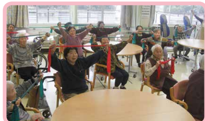
△ゴムを使って腕や足の運動