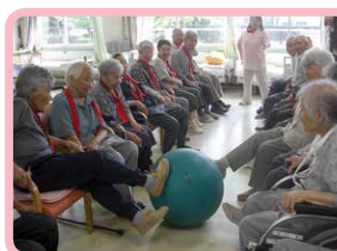
△ゲーム大会 足がよく動きます(7月)