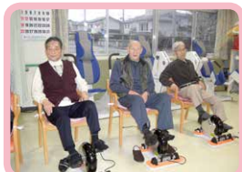
△エスカルゴで自転車漕ぎ