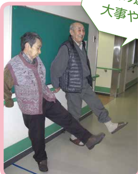
△手すりを使って足の運動