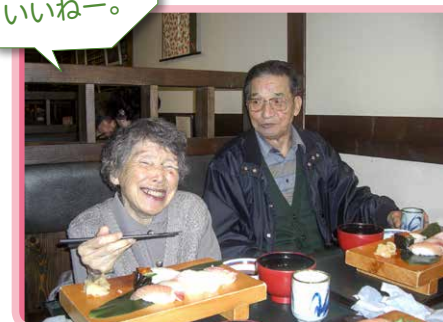
△食事ドライブ お寿司おいしかったです(11月)