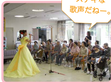
△あやめの会 慰問(6月)