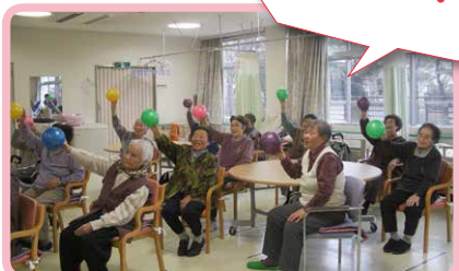
△ボールを使って腕や失禁予防運動