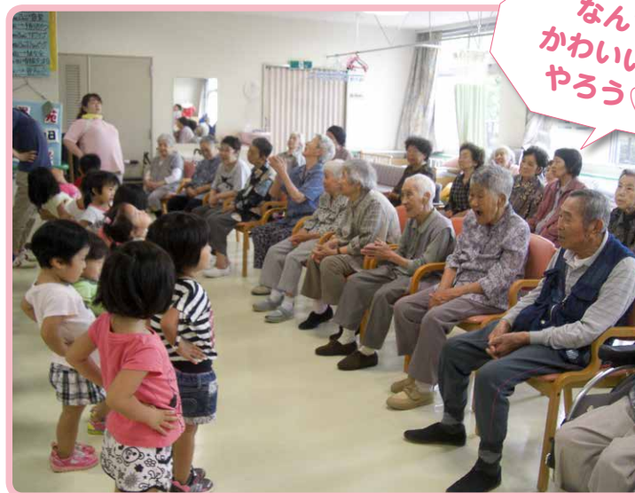
△保育園に元気をもらいました(8月)