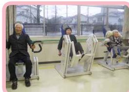
△トレーニングマシンを使って