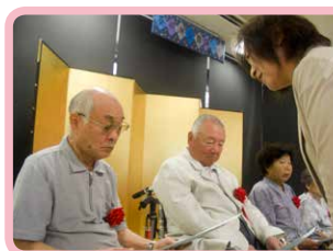
△敬老会 これからもお元気で(9月)