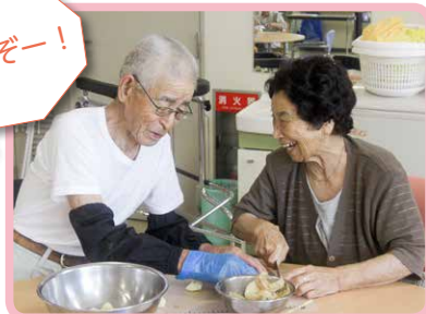
△力を合わせてじゃが芋おやき作り(8月)