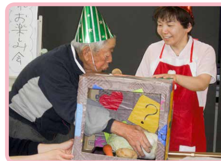
△年忘れ会 箱の中身はなんだろう?(12月)