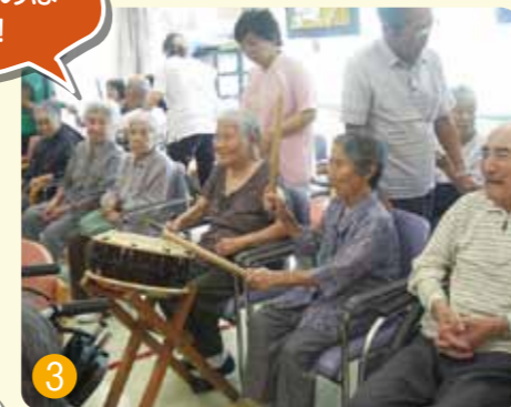
太鼓をたたくのは面白いね!