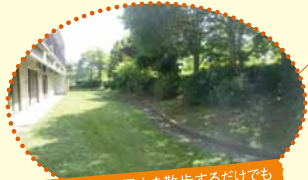
天気のいい日は園内を散歩するだけでも いい気分転換になります