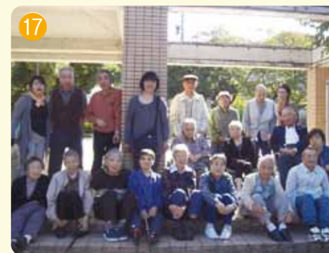
おいしいお寿司を食べてニッコリ!