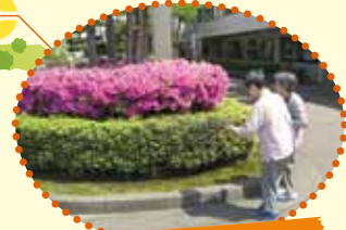
毎年5月上旬、正面玄関の 鮮やかなヒラドツツジ