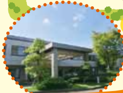
お客様や入所者をお迎える エントランスにも緑がいっぱい