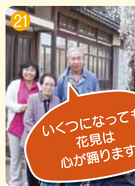
いくつになっても花見は心が踊ります