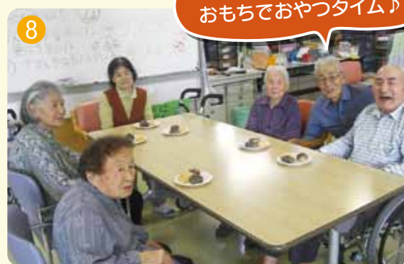
みんなで作ったおもちでおやつタイム♪