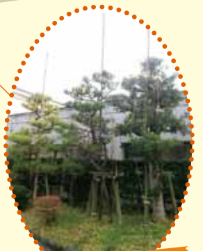
12月に入ると、中庭の 木も雪吊りで冬支度