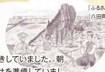
「ふるさと八田—今昔—」 (八田町会発行)より