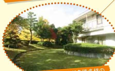
モミジやツバキ、カクレミノなど多種多様の 樹木が楽しめます