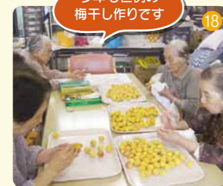
今年も恒例の梅干し作りです