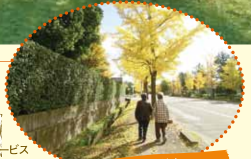
金沢競馬場に続く イチョウ並木に面しています