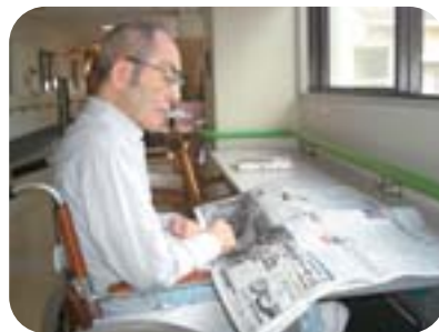
今日はどんな記事が出ているのかな？