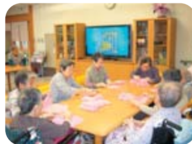
やっぱり年の功 仕事が早い！