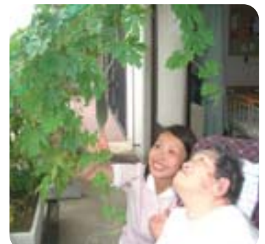
2Fベランダのグリーンカーテン