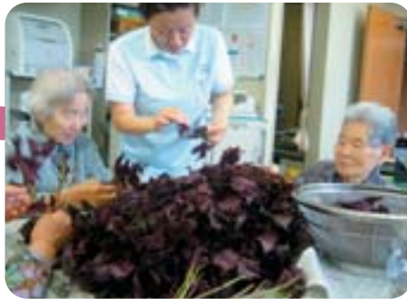
しその葉で色づけします。