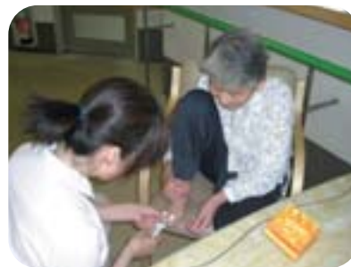
足爪も切ってもらい 清潔にしましょう