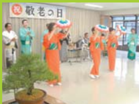
ご長寿、おめでとうございます