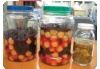
びんに入れて、土用の日まで待ちます。