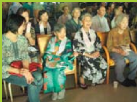
キレイな花火やね～