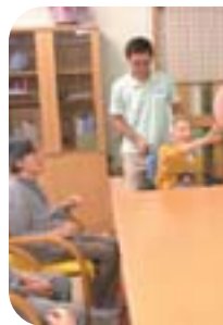
風船バレー 優勝目指