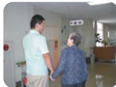
寝る前に一度 行っとこうね