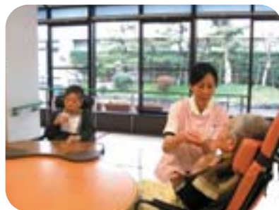
牛乳でカルシウム補給