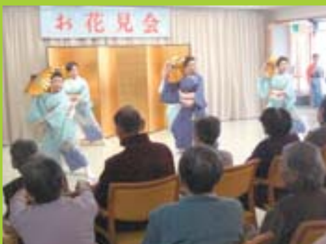
葵流照洲会による踊り