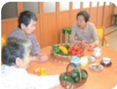
今年のゴーヤ茶 美味しいネ