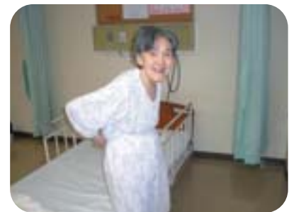
パジャマに着替えたし 後は良い夢をみるだけです