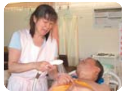
掛け湯をして あがりましょうね