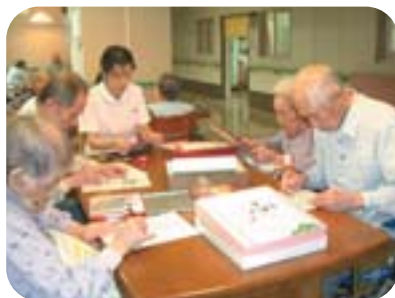
八田ホームオリジナルかるた 今年中に作るゾ