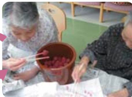
干す・かめに戻すを3回繰り返します。