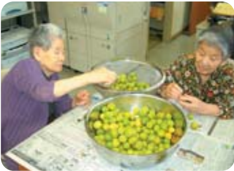
まずはヘタ取りをし、塩漬けします。