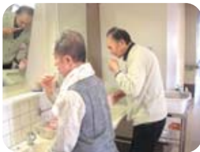
爽やかに朝の洗面