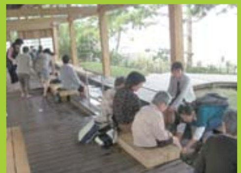
温泉に行って来ました