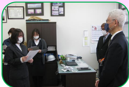
辞令交付式で誓いの言葉を述べる新規採用職員