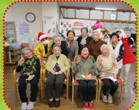
皆さんステキな笑顔です♪

12月23日(月)24日(火)の2日間、クリスマス会を行いました。ビンゴゲームやお菓子釣りゲームをしました。「あれ～揃わない」「あと一つで揃うわ」等の声が聞かれました。余興では、『すてきなホリディ』と『クリスマス・イブ』の音楽に合わせて、職員がダンスを披露しました。利用者の皆さんも一緒に踊ったり手拍子したりして楽しめました。