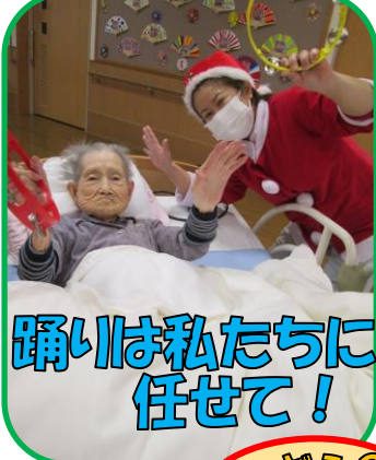
踊りは私たちに 任せて!