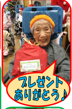
プレゼント ありがとう♪