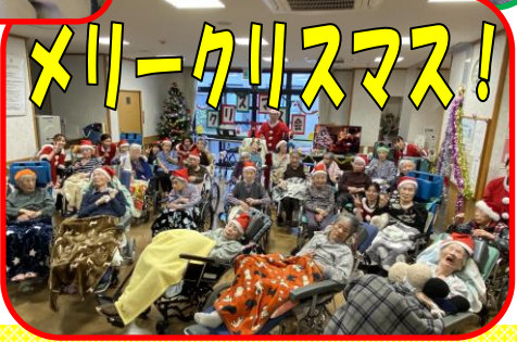
メリークリスマス!