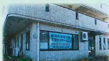
平成18年4月 新潟市地域包括支援センター石山開設