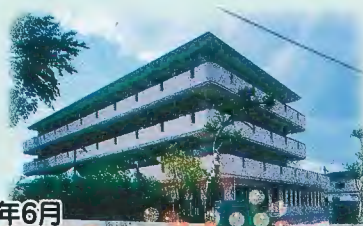
平成10年6月 社会福祉法人徳栄福祉会設立