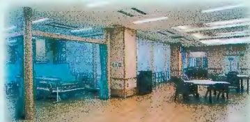
平成11年7月 ケアハウス・デイサービスセンター 在宅介護支援センター開設