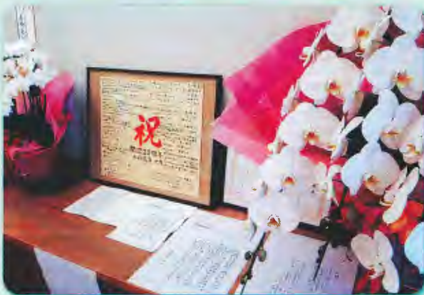
ケアハウス入居の皆様からお祝いの 寄せ書きをいただきました