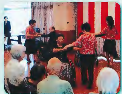
華麗な車椅子ダンスの披露

令和の時代が幕開けし、私達は今後一層お客様サービスの追求と、安全で安心できる法人運営を目指したいと思います。これからもご指導ご鞭撻の程よろしくお願い致します。