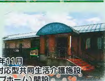
平成20年11月 認知症対応型共同生活介護施設 (グループホーム)開設