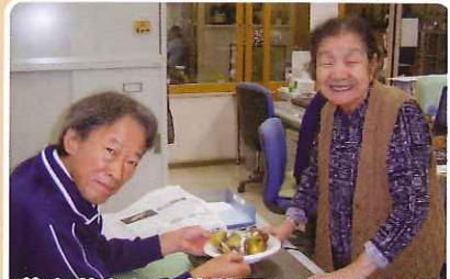
取れた芋を蒸かして施設長へおすそわけ。