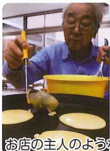
お店の主人のような風格です。