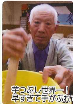
芋つぶし世界一！！ 早すぎて手がぶれてます。