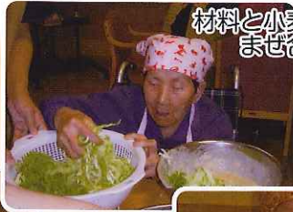
材料と小麦粉を 混ぜ合わせます。