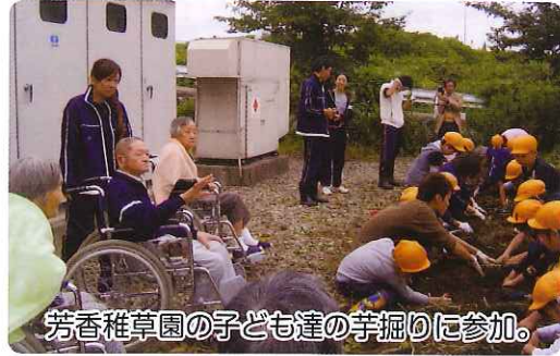
芳香稚草園の子ども達の芋掘りに参加。