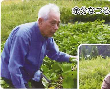
余分なつるは全部取って…