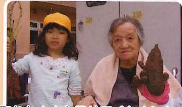
大きい芋が取れた！！と見せてくれました。