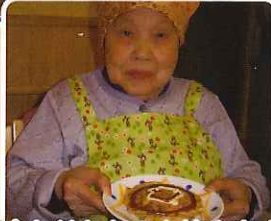
混ぜ合わせたものを焼き完成！ 上手にでき上がりました。 自信作です。