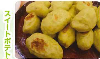
スイートポテト完成！！