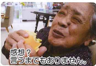
感想？ 言うまでもありません。