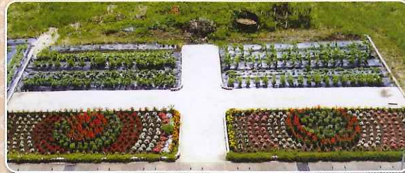
7月の水害にも負けず、とてもきれいに咲きました。