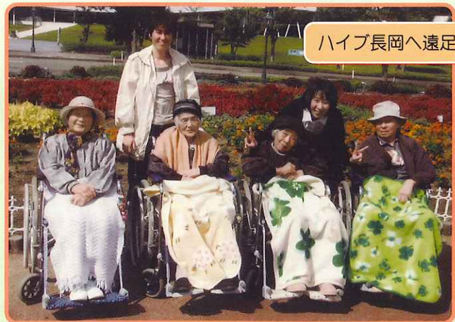
ハイブ長岡へ遠足