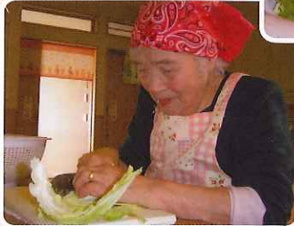
丁寧な手つきでキャベツを 切って下さいました。