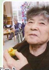
んふっ♪ あんまり美味しくて 笑みがこぼれます。