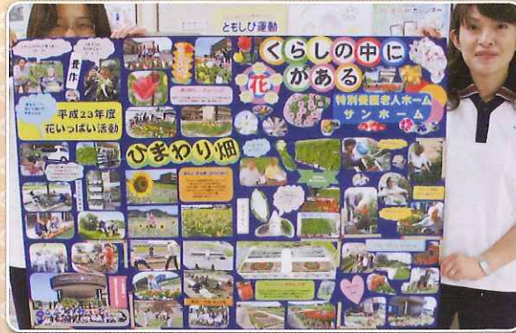
長岡市の<花いっぱい運動>で優秀賞を受賞しました。