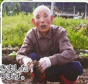
大きなさつま芋が出てきました！ 男性の皆様、頼りになります。