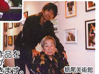
ゆっくり魚や作品を 見てとても心が リラックスできます。