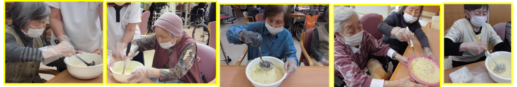
14日 調理レク : お好み焼きを作っておやつに食べました。しょっぱいおやつもおいしいですね。

初夏の爽やかな緑が美しい季節になりました。散歩や体操など、身体を動かすのにも良い時期です。本格的に暑くなる前に体力をつけ、夏を乗り切りましょう！