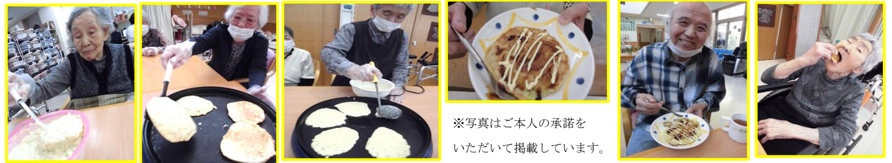
※写真はご本人の承諾を いただいて掲載しています。