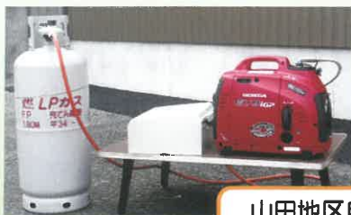
山田地区自主防災会