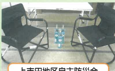
上吉田地区自主防災会