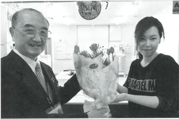
グループホーム陽だまりの家にて

3月初め、民生委員の協力により、支援が必要な一人暮らし高齢者や重度障がい者のお宅を訪問、見守り支援を兼ねてカーネーションの花をお届けしました。また、町内の高齢者・障がい者施設には社協会長が訪問し、花束をお届けしました。皆さんから一足早い春を楽しんでいただきました。