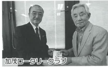
加茂ロータリークラブ