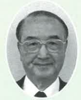
社会福祉法人田上町社会福祉協議会