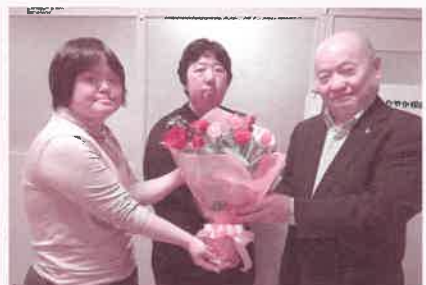
障がい者支援センター

3月上旬、民生委員の協力により、支援が必要な一人暮らし高齢者や重度障がい者のお宅を訪問し、孤立感の解消や見守り支援を兼ねてカーネーションをお届けしました。