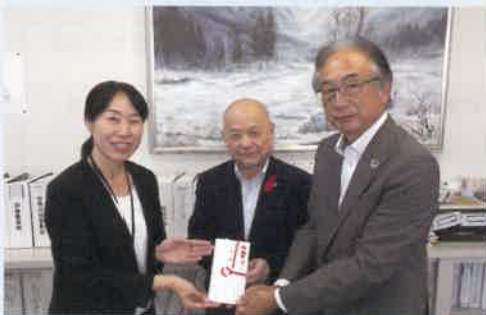
（公財）新潟ろうきん福祉財団様