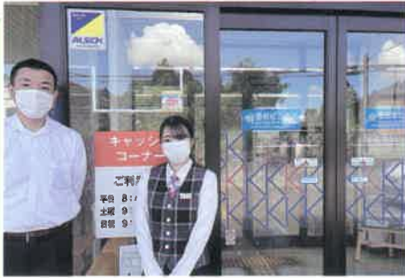
協栄信用組合田上支店