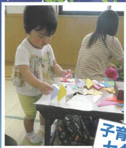
子育てサロン 七夕の様子