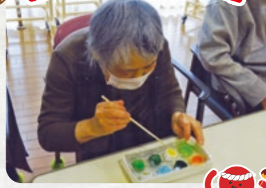
手首を使って上手にキャップをひっくり返すゲームです。