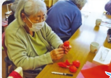
手先の運動になるから頑張ります♪