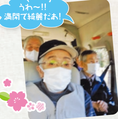
うわー!! 満開で綺麗だね!