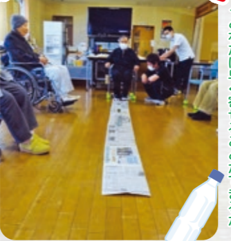
ペットボトルを乗せた新聞紙を片足でこれだけ早く寄せられることができるか