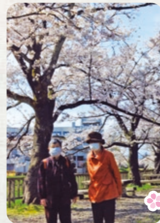
青田川沿いの桜の下で

暖かい日差しの中、満開の桜を見に青田川・儀明川沿い・高田城址公園にドライブに出かけました。