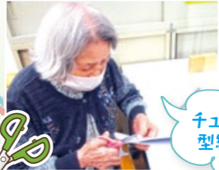
チューリップ型に型紙を切ります