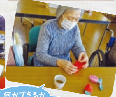
何ができるか楽しみ♡