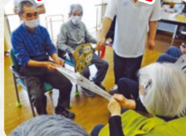
新聞が破れたら負け「はっけよい」「のこった」