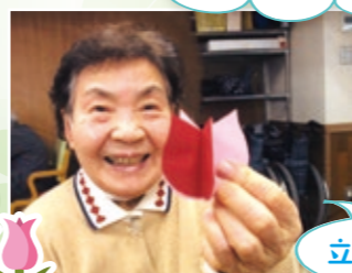
立体的なチューリップが完成!