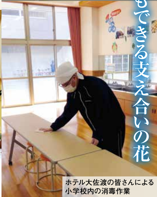
ホテル大佐渡の皆さんによる 小学校内の消毒作業