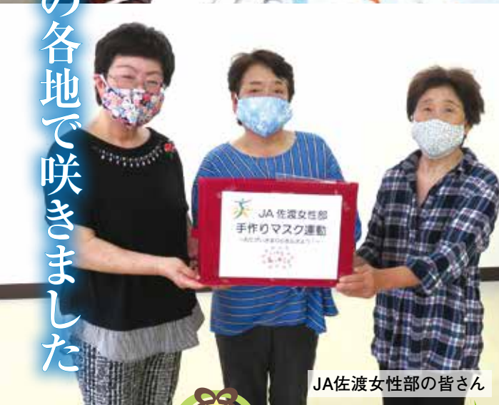
JA佐渡女性部の皆さん