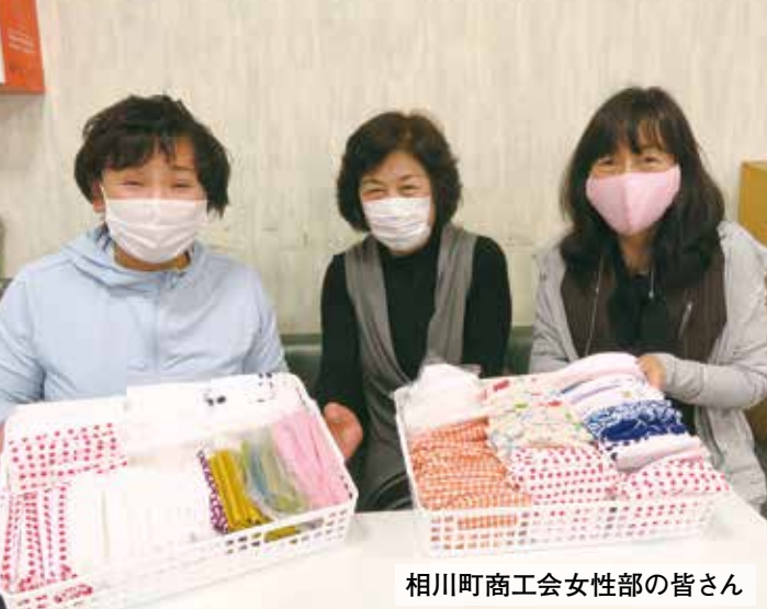
相川町商工会女性部の皆さん