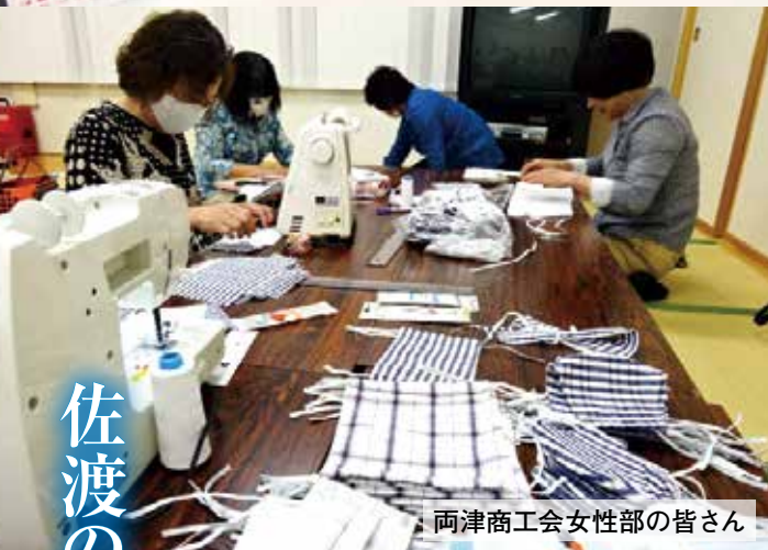
両津商工会女性部の皆さん