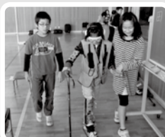
高齢者疑似体験の様子