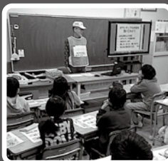
地域の方が先生に!