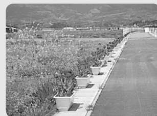
国道沿いのチューリップ

これからもこの活動を続けていきたいと考えています。また、チューリップ以外の特産品(八幡いも等)のPRも出来たらなと思っています。