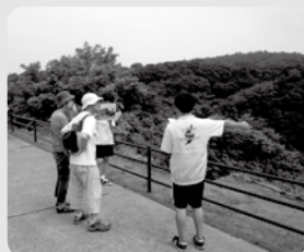
北沢浮遊選鉱場でのガイドの様子