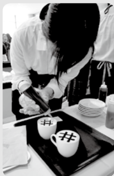
ラテアート作りの様子

島内のおしゃれなカフェを1ヶ所に集めて紹介し、地元の方に佐渡の魅力を再発見してもらおうという活動です。5月6日(日)のイベント当日はあいぽーと佐渡を会場に、島内のカフェ4店舗が出展し、共同販売をしました。生徒自身もお店とラテアート作りの様子コラボしたオリジナルラテアートの販売や、募金を集めて作成したパンフレット(両津近辺のカフェのお勧めメニューを紹介した物)の配布をしました。