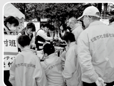
研修や訓練の様子

※1 災害時の様々な困りごとの情報の集約や、被災地支援を目的に、ボランティアの受け入れや派遣等を行う組織