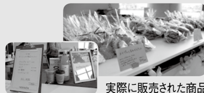
実際に販売された商品

11月11日(日)あいぽーと佐渡で2回目のイベントを実施予定です。今回も多くのカフェにご協力いただく予定です。皆さんお越し下さい。また、12月2日(日)には後輩チームが佐渡の食材を使用したスイーツを提供するイベントも実施します。こちらの方にもぜひお越し下さい！