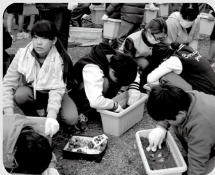
チューリップの球根植え

この活動は八幡・銀杏の会と合同で平成15年から取り組みを始めました。一昔前、八幡では特産品であるチューリップをたくさん生産していましたが、年々生産量が減少していました。再び八幡の町をチューリップで盛り上げようという気持ちから、この活動が始まりました。