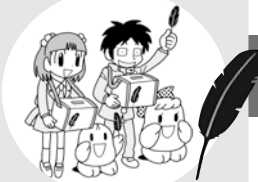
街角や人の集まる場所での街頭募金