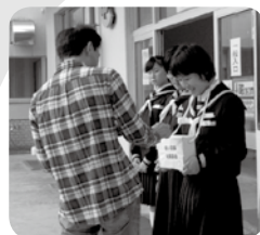
保育園や幼稚園、各学校のご協力による学校募金

株式会社 遠市 様(相川地区) 「赤い羽根共同募金に協力すると、あったかい気持ちになれるんです。」 と話す社長さんは、地域の皆さんが笑顔になることを願って長年多額のご寄付を続けてくださっています。