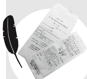
自治会等のご協力 による戸別募金