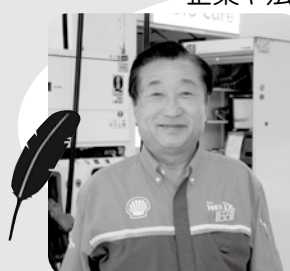
企業や法人のご賛同による法人募金

株式会社 遠市 様(相川地区) 「赤い羽根共同募金に協力すると、あったかい気持ちになれるんです。」 と話す社長さんは、地域の皆さんが笑顔になることを願って長年多額のご寄付を続けてくださっています。