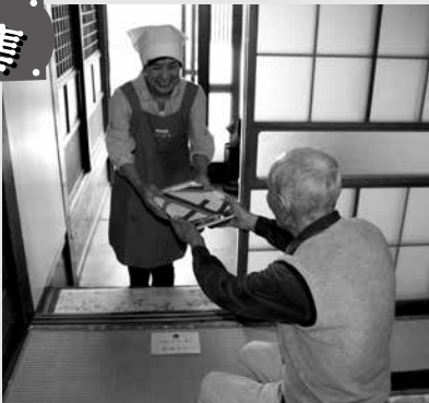
配達ボランティア