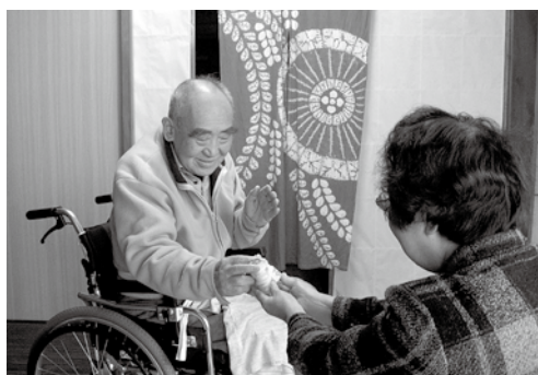
見守り活動の様子