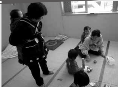
託児ボランティア