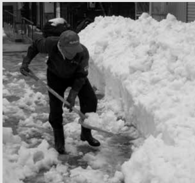
除雪ボランティア