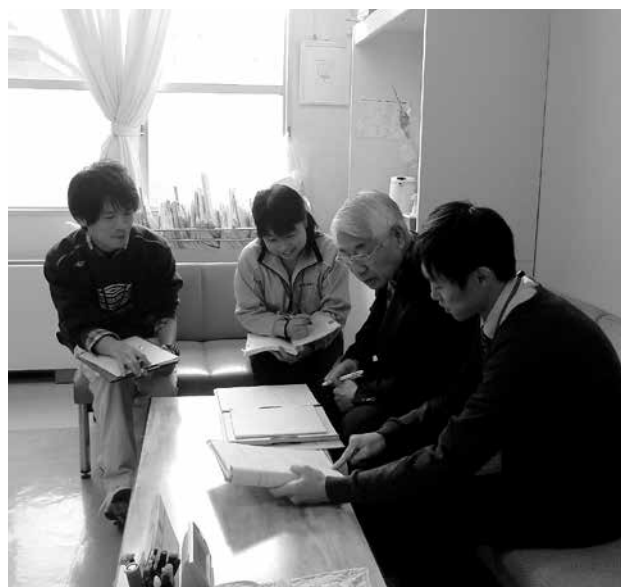
「本人への支援について打ち合わせを行う 市民後見人、病院の相談員、成年後見センター職員」

また、この制度では、あらかじめ自分の成年後見人となる人を選出しておくこともできます。これは、判断能力が十分なうちに自分の意思を表明することができるので、安心して老後を迎える手段のひとつにもなると考えられます。