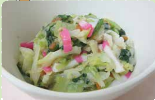
キャベツとかまぼこの 酢味噌和え

野菜類は、繊維がどのように走っているかを見て、繊維を断ち切るように切ると食べやすくなります。