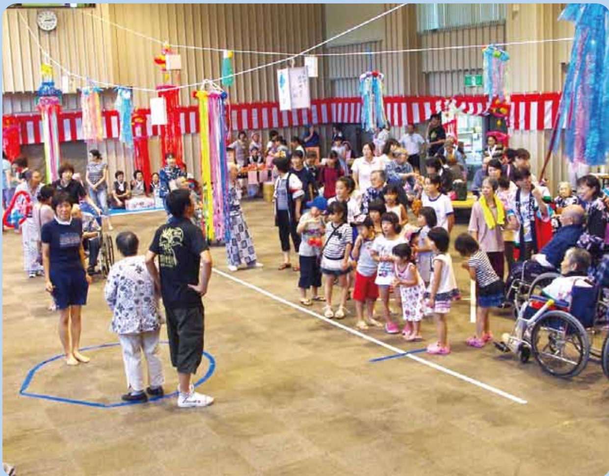
【 小木地区 つくし納涼祭 】