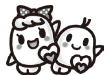
【愛ちゃんと希望くん】

皆さまの“お互いを思いやる優しい心”に支えられている赤い羽根共同募金。このまちをもっともっとよくしていくために、今年もご協力をよろしく願いします。