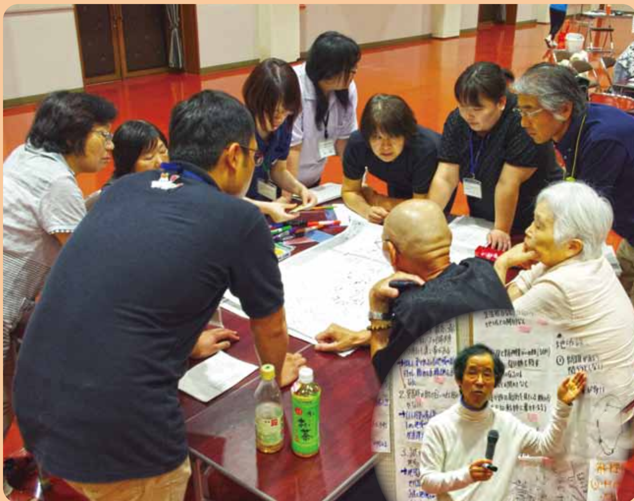
【支え合いマップ・インストラクター養成講座】