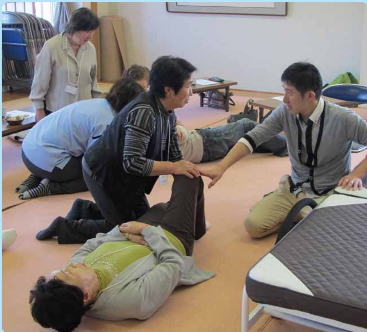
【両津地区 介護者リフレッシュ事業 家族介護教室に参加】