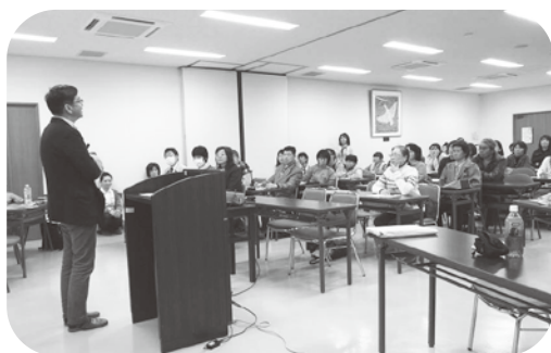
▲3月30日に開催された講演会の様子