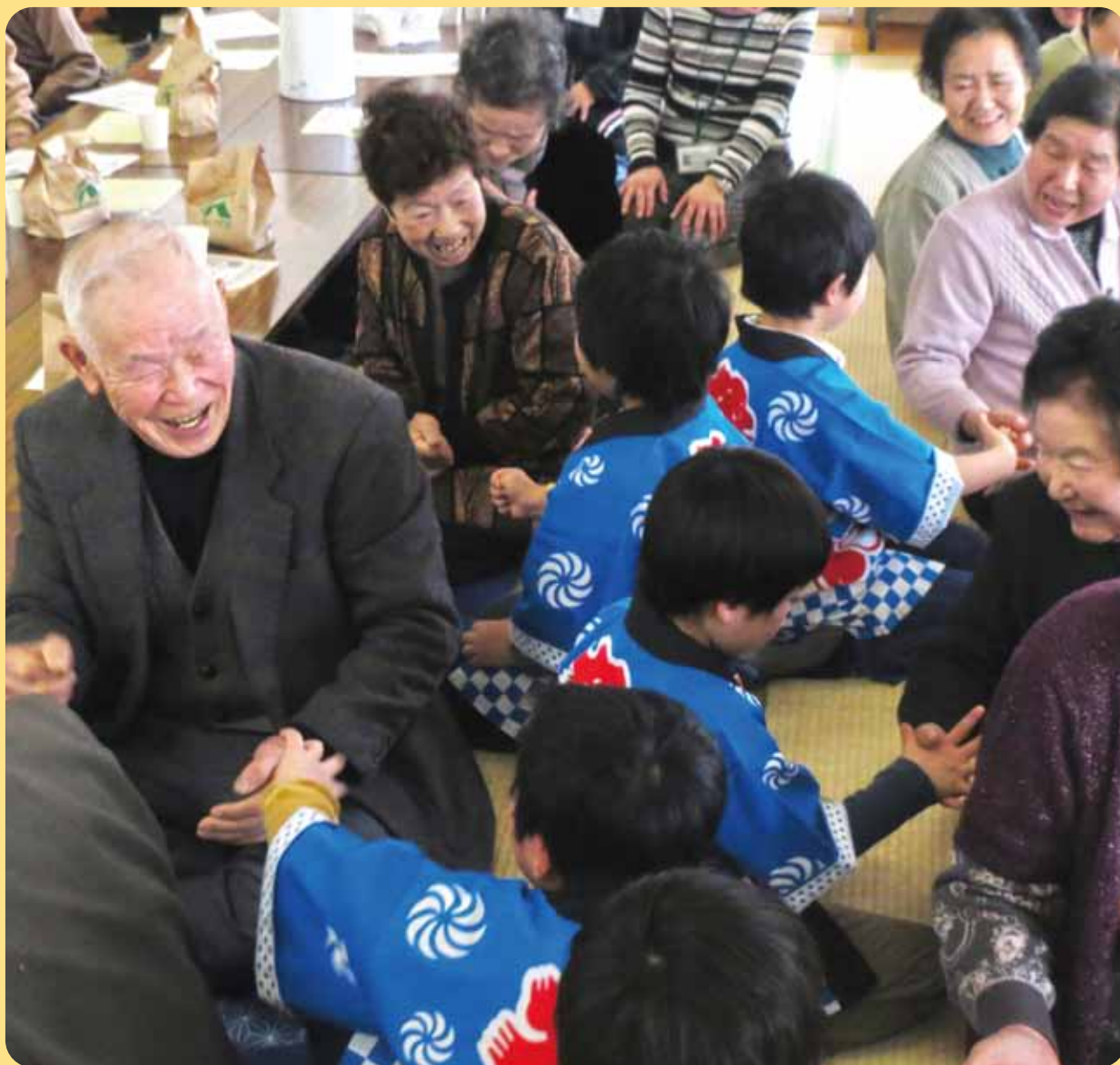
【金井地区ふれあい招待昼食会】