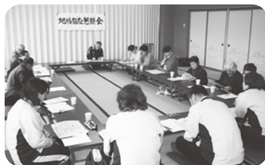
▲地域福祉懇談会の様子

また、地域の皆さんから日頃思っていること、困っていることなどを教えていただき、今後の地域福祉活動に活かしていきます。