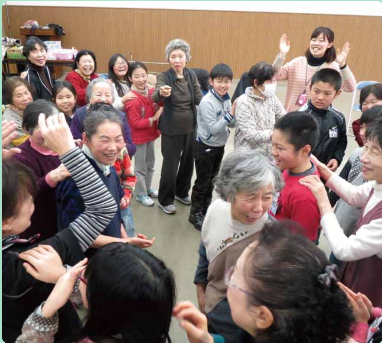
【介護予防教室「笑顔・キラキラ」 河原田小学校4年生と交流】