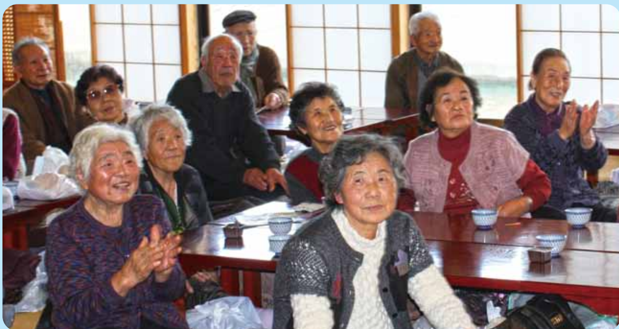
【ワイドブルーあいかわ ふれあい招待昼食会】

民生委員さんやボランティア、そして地域の余興団体の協力を得て、ふれあい招待昼食会を開催しました。