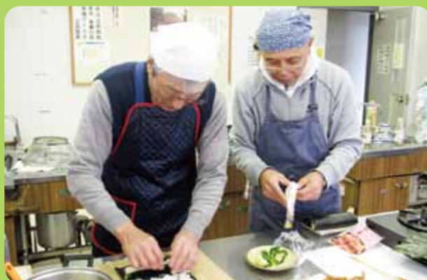
【両津地区 男性の料理教室】