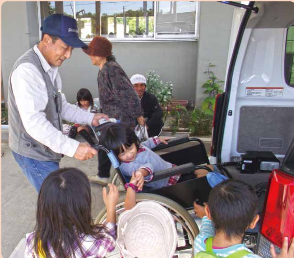
【新穂・畑野・真野社協まつり 福祉車両体験】

「新穂・畑野・真野社協まつり」では、福祉車両体験や余興、美味しい食べ物販売など様々なコーナーを設けて開催しました。また、東日本大震災チャリティーバザーでの売上げ金 76,567 円を義援金として共同募金会を通じて送金しました。ご協力ありがとうございました。