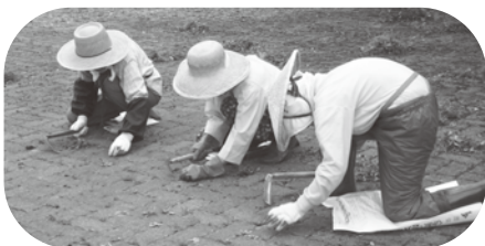
▲奉仕作業の様子（真野地区）

残暑が残る秋晴れに、奉仕作業中の老人クラブのみなさんに会いました。慣れた手つきで着々と草刈り、草むしりの作業を進めていました。時々、笑い声も聞こえます。