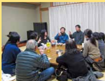
手話サークル 両手の会