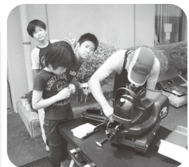
▲しゃくなげまつりおもちゃ病院の様子