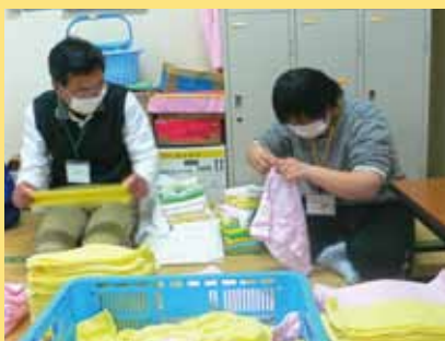
ぷれジョブ佐渡（障がいを持つ方の就労支援）