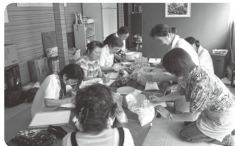
▲福祉関係団体の活動費に（サロン活動）

地域の茶の間や見守り活動を行う福祉関係団体等への活動費助成など、地域福祉推進のための様々な事業に役立てられています。