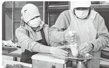
▲NPO法人サザンクローバー 味噌製造材料費に