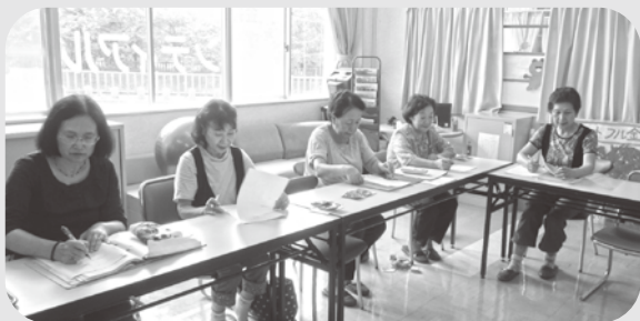
▲ミーティングの様子

※電話に出られない時や、会話の中で気になる方がいた時は、ボランティアと職員が連携し安否確認に努めています。