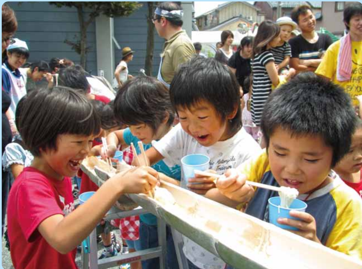
【第17回しゃくなげまつり】