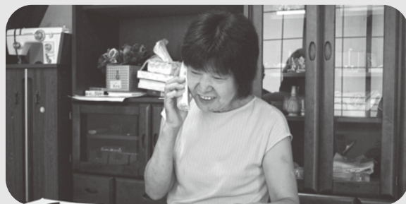
▲おはようコールの様子

島内のおはようコールボランティアの方たちとも交流し、仲間や出会いが広がることも楽しみの1つです。