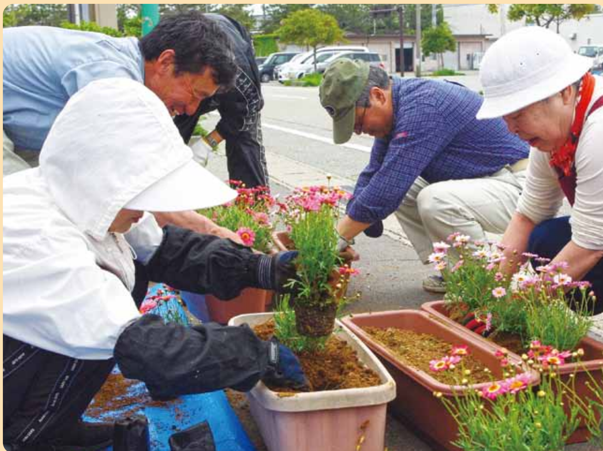
【小木地区 ボランティアの集い】