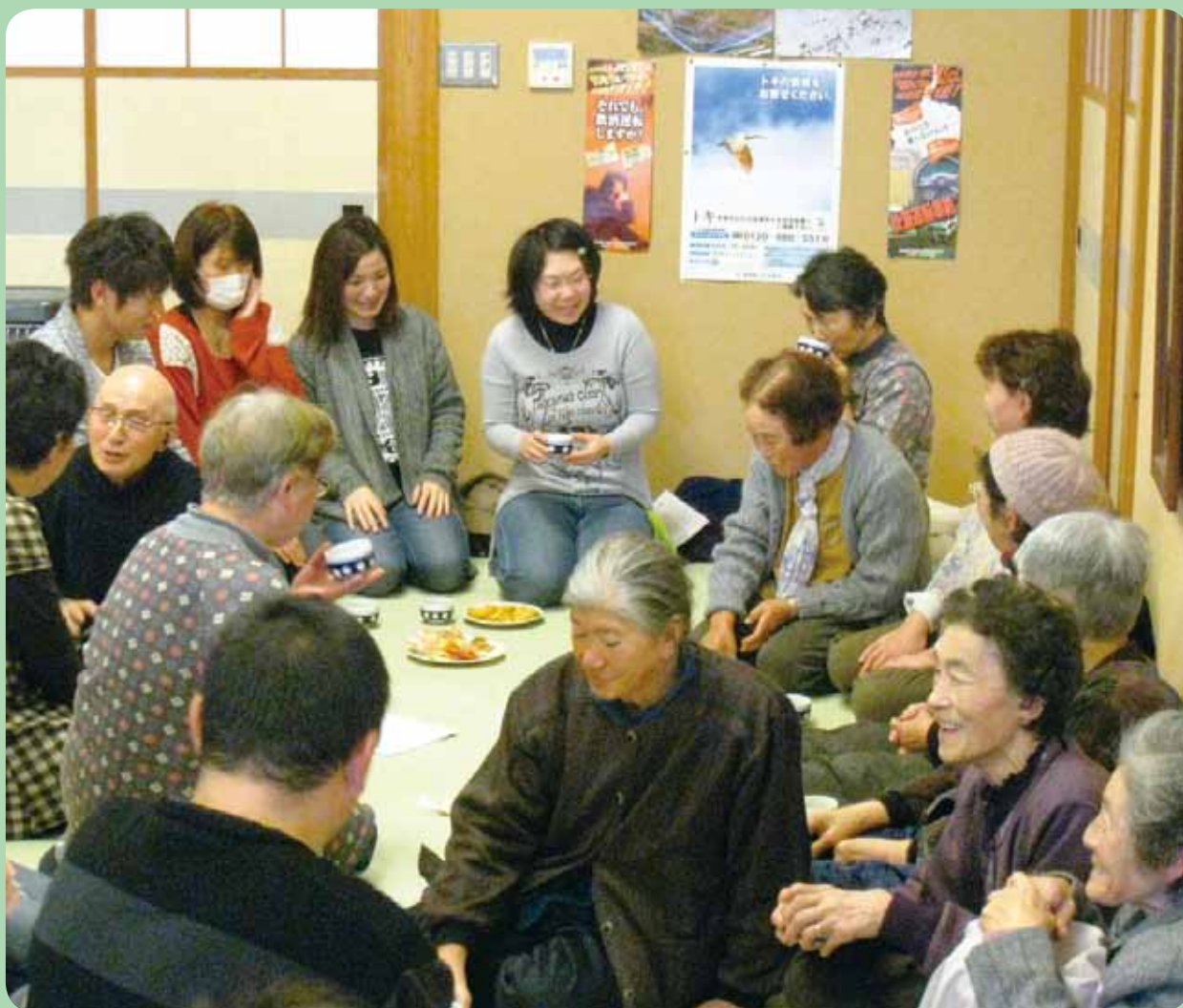
【大和の茶の間 専門学校生との交流】