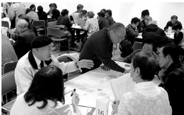
▲グループに分かれて話し合う参加者の様子

メンバーやボランティアの不足、会場までの交通手段、男性の参加を増やしたい、企画内容の充実についてなど、困っていることは共通したものが多くあります。