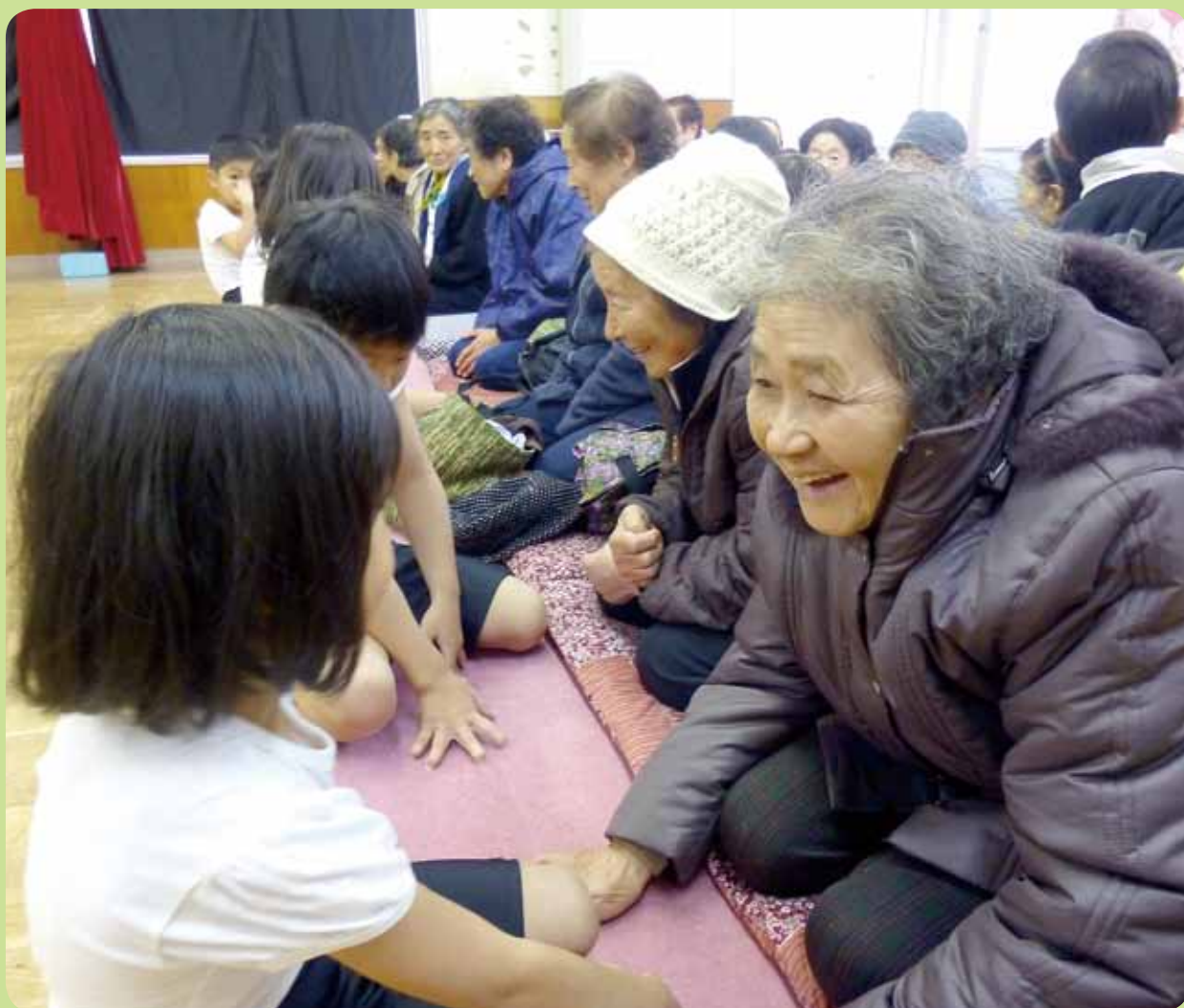
【川西保育園児との交流会】