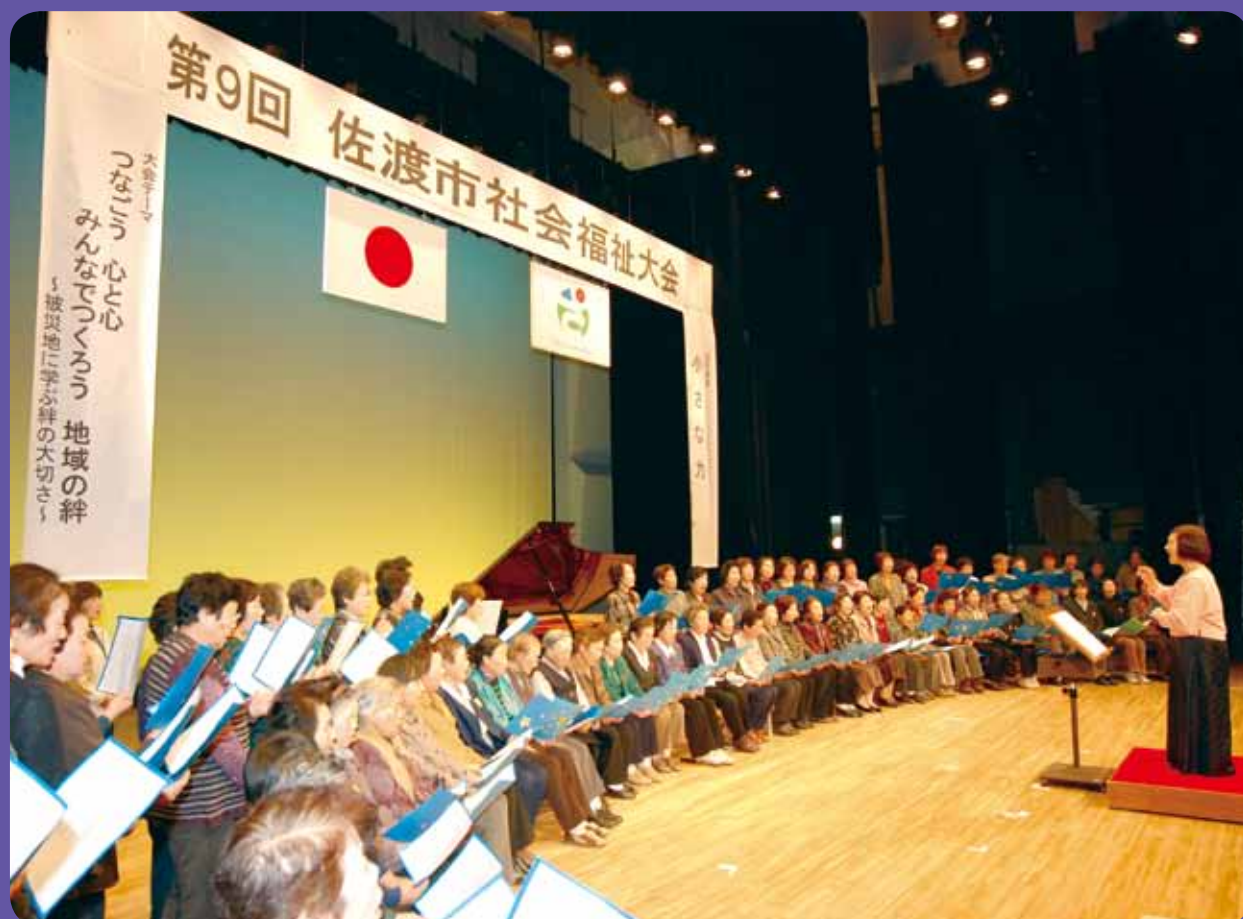
【第9回佐渡市社会福祉大会】