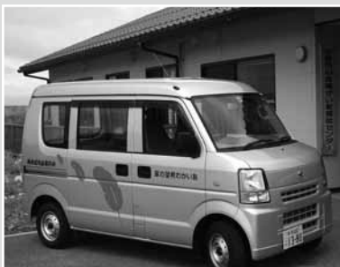
▲あいかわ希望の家の共同募金配分車両

福祉施設の車両や備品の整備、小規模作業所の運営費、福祉団体の事業費等に役立てられています。