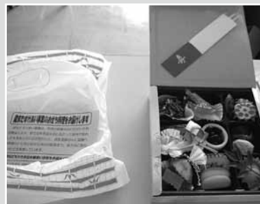
▲おせち料理の配布

佐渡市内の高齢者世帯、障がい者の方等が気持ちよく新年を迎えられるよう使われています。