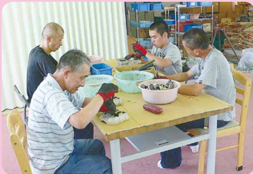
【障がい者施設の備品整備・愛らんど畑野の作業台】

皆さまの優しさに 支えられている赤い 羽根共同募金は、 わたしたちのまちの 様々な活動に役立て られています。