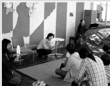
▲両津絵本と子どもの会の絵本のよみきかせ

福祉まつりの開催、福祉団体への助成等の佐渡市内の福祉活動の向上に役立てられています。