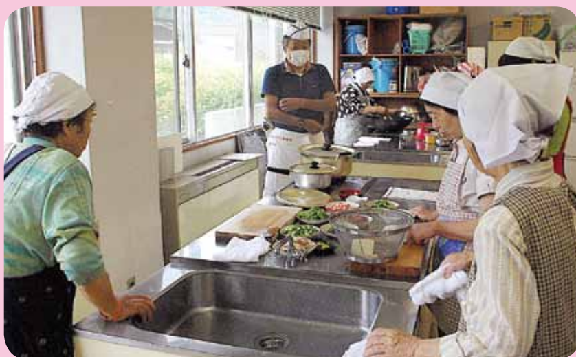
【高齢者料理教室の実施:羽茂地区長寿健康料理教室】