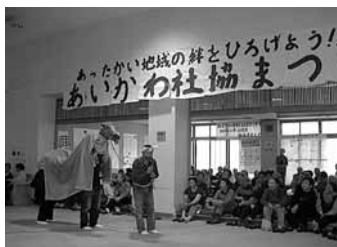
▲あいかわ社協まつり(相川)