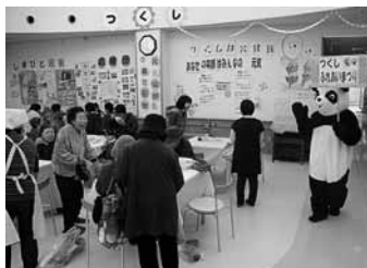
▲つくしふれあいまつり(小木)