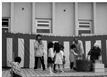
▲社協まつり(畑野・新穂・真野)