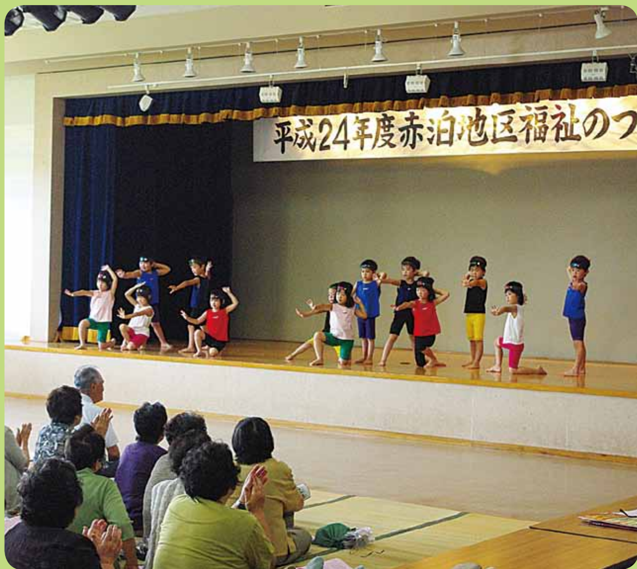
【赤泊地区の福祉のつどいの様子】