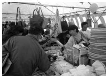
▲かない社協まつり・福祉バザー(金井)