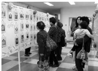
▲やすらぎふれあいまつり(赤泊)

9月から11月にかけて、各地で社協まつりを開催します。開催日は順次ご案内しますので、多くの方のご参加をお待ちしています。